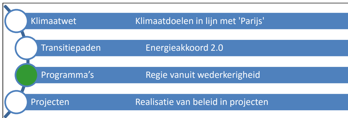
Figuur 1. Van internationale politiek naar concrete uitvoering in projecten

Op dit moment ziet de nationale beleidssturing er grofweg als volgt uit: